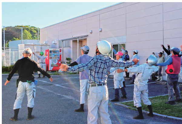
朝の就業前ラジオ体操