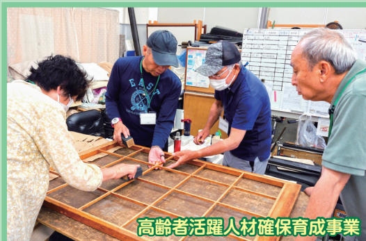
高齢者活躍人材確保育成事業

会員が講師となり、障子・網戸の張替作業の手順やポイントを体験していただきました。きれいになった障子・網戸を見て、自分でも出来る自信や喜びを実感されたようです。