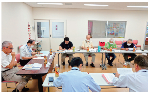
宗像市と定期的に合同衛生委員会を開催