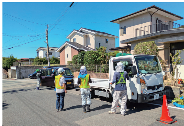
就業現場の安全就業パトロール