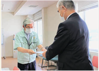
委嘱状交付 (広報・啓発推進委員会)