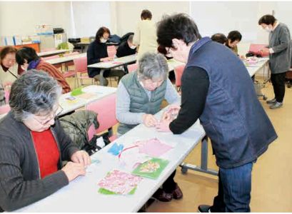
折り紙サロン (生活援助・子育て支援推進委員会)