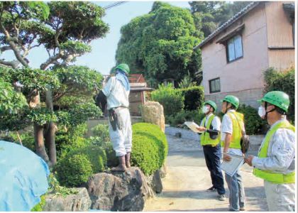
安全パトロール (安全・適正就業推進委員会)