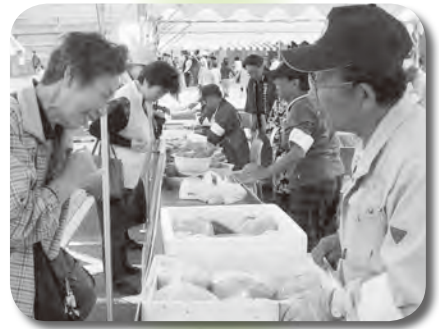
新鮮な農産物・ボカシ販売