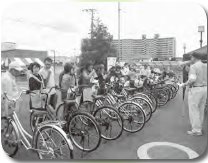
リサイクル自転車販売