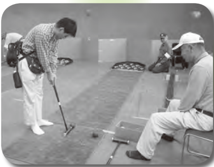
お父さんも楽しんだスカットボール