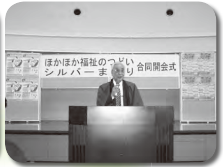
シルバーまつり開会式