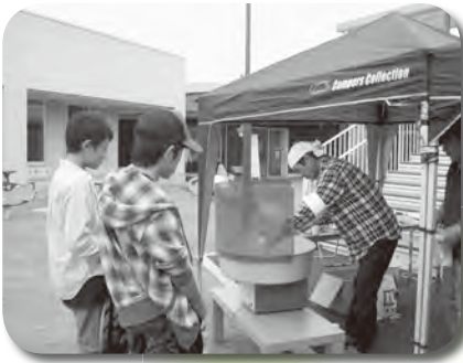
大人気！わた菓子づくり