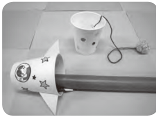
けん玉とロケット

今回は紙コップや新聞紙など家にあるものでできる「けん玉」と「ロケット」です。年中と年長の組の子どもたち約三十人。みんな真剣に作り始めたかと思うと、