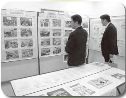
シルバー人材センターの活動紹介