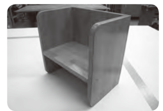
立派なイスができました

十一月三十日(土)、ワークスペースにおいて、子育て支援センターとの共同企画で子ども用箱イスづくり講座を開催しました。シルバー人材センターの生活サポート班会員2名が講師となつて、子育て支援センター利用のお父さん、お母さんたち(計7名)が、合板の切り出しに始まり、穴開