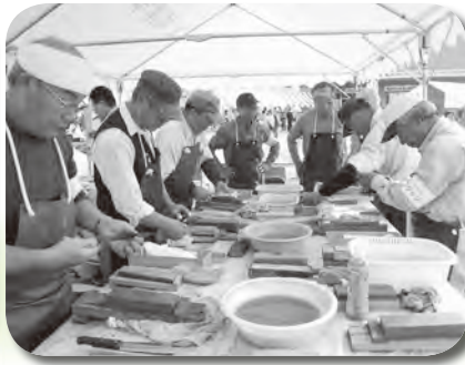
チャリティー包丁研ぎ