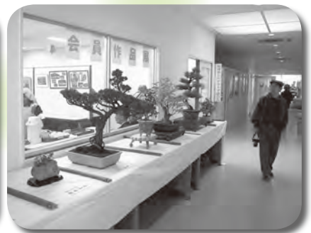
力作揃い！会員作品展