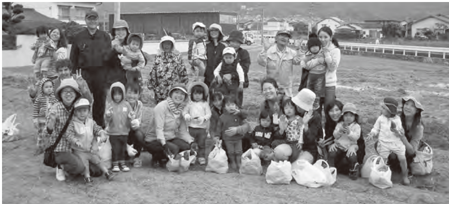
たくさん収穫できました！