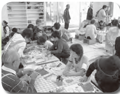
子どもたちとおもちゃ・小物づくり