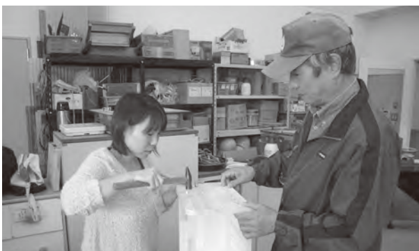
お母さん、慣れた手つきです

ます。また地域交流等の事業についても積極的に展開を図っていきます。 また会員の増強と就業場所の確保は車の両輪であり、どちらが欠落しても事業の発展はありません。昨年は校区別学習会を開催し、会員の方にセンターの現状や課題について更に理解していただき、新規入会促進の協力をお願いしました。 た。また理事会では市内の会社・商店等を訪問し、就業開拓活動を行っております。シルバー人材センター全員でこれらの目標を実現していく所存です。どうぞ皆様のご理解とご支援の程よろしくお願い申し上げます。