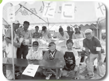
たこ焼販売コーナー

今年度の普及啓発促進事業「シルバーまつり」はフクスタ・子育て支援センターを一部開放していただき、来場者には三つのエリアを歩き来しながら、催しに参加していただく新たな試みで実施しました。およそ千百名の参加で、特に初企画のたこ焼コーナーは早々に完売するなど、各コーナー共に活気にあふれていました。なお、チャリティー売上金三五、八五三円は伊豆大島台風24号災害義援金として日赤を通してお送りしました。