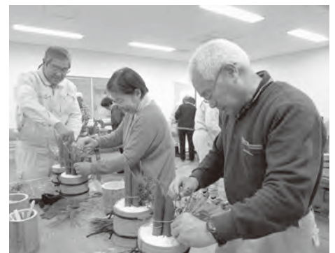
もうすぐ完成です

切ったり、男結びという結び方で苦勞しながら縄を結んだりして形作っていました。仕上げに松や梅、南天を自分のセンスで生けて出来上がりです。 参加した方からは「丁寧に教えてもらいました」「童心に返って楽しかった」「また来年も参加したい」などの感想をいただきました。出来上がった作品を眺める皆さんの嬉しそうな表情に、こちらも明るい新年を期待したくなる心温まる一日でした。